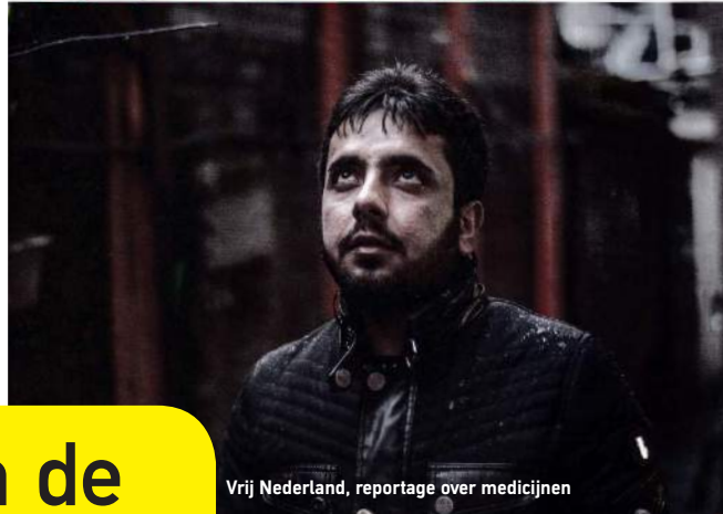
Vrij Nederland, reportage over medicijnen

binnenland Kunnen uitgeprocedeerde asielzoekers wel vijf euro betalen voor hun medicijnen? Binnen de PvdA begint het te rommelen. door Harm Edé Borja en Mischa Cohen