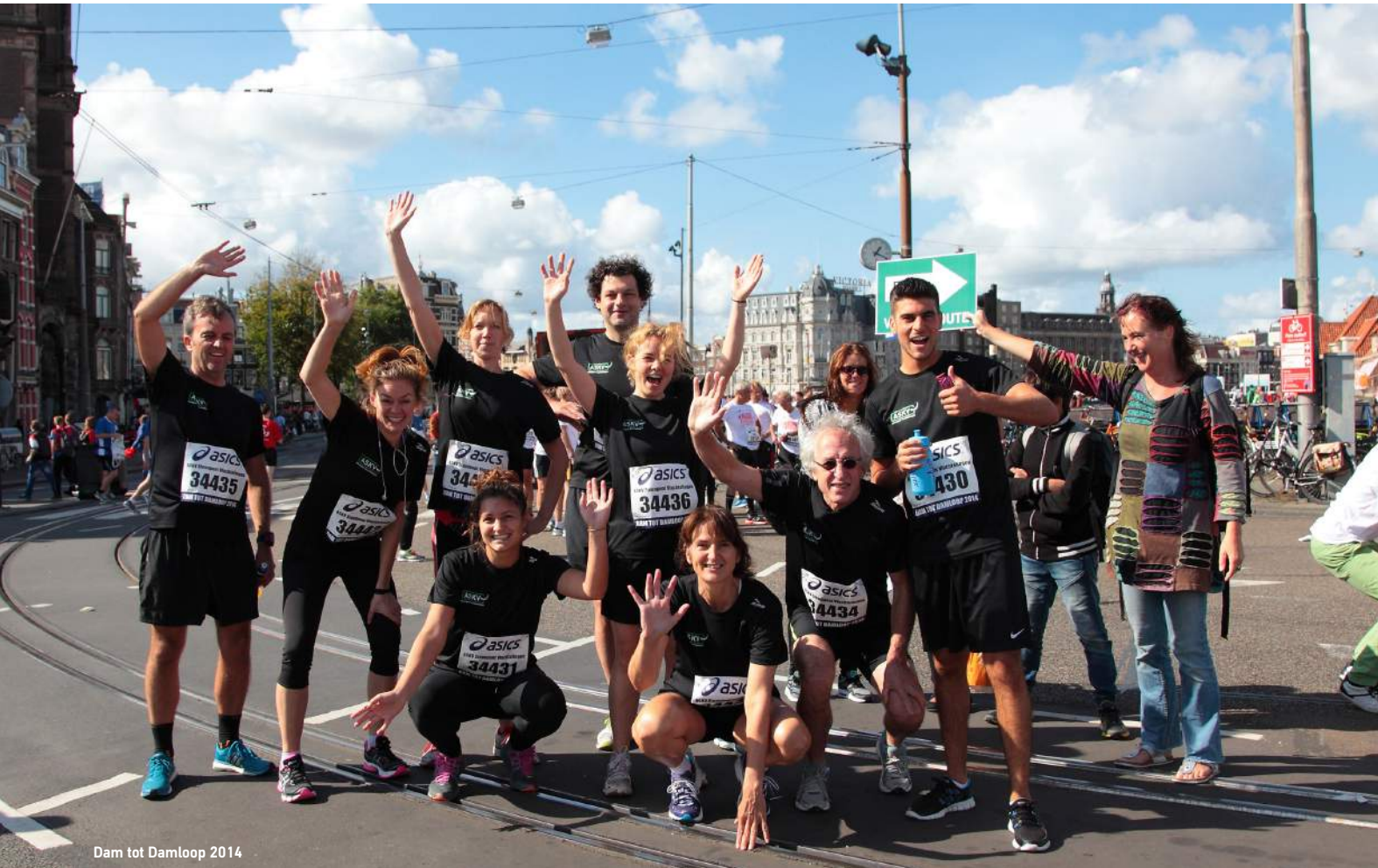
Dam tot Damloop 2014