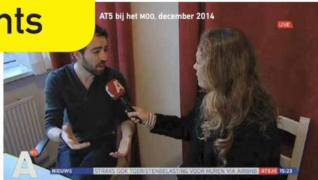
AT5 bij het MOO, december 2014