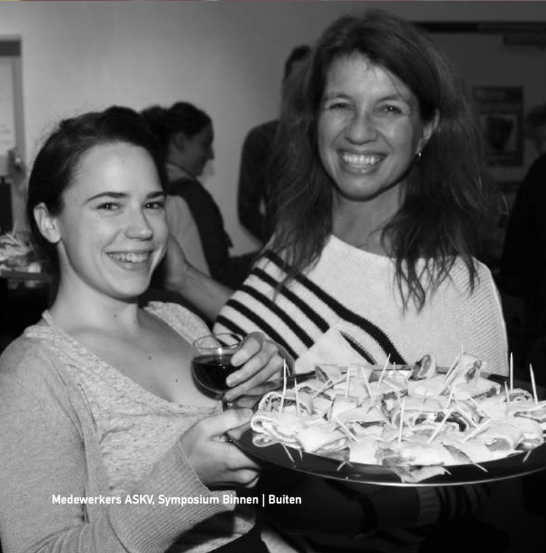
Medewerkers ASKV, Symposium Binnen | Buiten