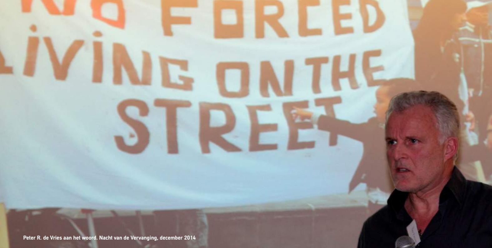
Peter R. de Vries aan het woord. Nacht van de Vervanging, december 2014

In 1987 werden het ASKV (Amsterdams Solidariteits Komitee Vluchtelingen) en het Steunpunt Vluchtelingen de Pijp opgericht naar aanleiding van de verharding van het asielbeleid. In 1989 fuseerden beide organisaties, waarna de stichting onder de naam ASKV / Steunpunt Vluchtelingen verder is gegaan.