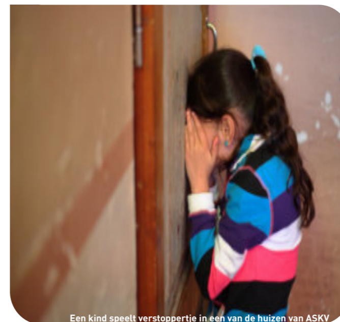
Een kind speelt verstoppertje in een van de huizen van ASKV

Maatwerk staat centraal in de opvang bij MOO-Basis. Dit betekent dat individuele cliënten met aandacht worden opgevangen en dat de begeleiding wordt aangepast aan de mogelijkheden, behoeften en het welzijn van de cliënt. De