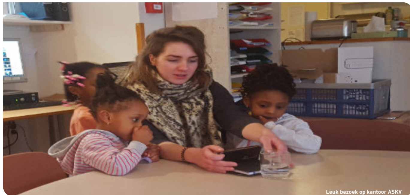
Leuk bezoek op kantoor ASKV

Na bijna twee jaar heeft de LVV-pilot geleid tot een betere samenwerking tussen de verschillende partijen. Bovendien is er meer zicht op de ongedocumenteerden in de stad, en zijn er meer financiële middelen beschikbaar voor begeleiding en opvang. Toch blijkt het nog steeds moeilijk te zijn om bestendige oplossingen te vinden. Onder meer door het verdwijnen van de discretionaire bevoegdheid en het gebrek aan doorzettingsmacht bij de IND en DT&V. ASKV heeft dit, samen met Stichting LOS en vluchtelingenorganisaties uit de andere LVV-steden, regelmatig besproken met het Ministerie van Justitie en Veiligheid, Tweede Kamerleden en gemeenten.