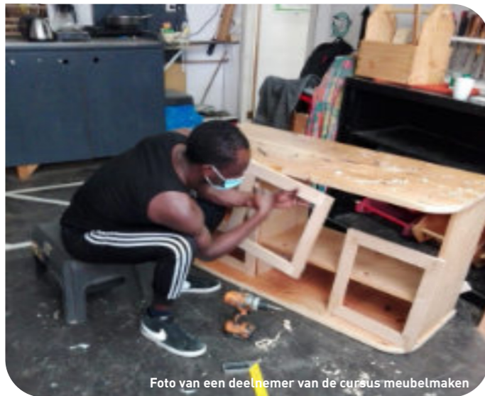
Foto van een deelnemer van de cursus meubelmaken

Ondanks corona zijn 283 deelnemers gestart met een praktijkleertraject of cursus. Die cursussen werden online, offline of in hybride vorm aangeboden. In totaal hebben 170 deelnemers een praktijkleertraject of cursus afgerond. In 2020 zijn 32 buddykoppels gestart; rond de jaarwisseling waren 25 buddykoppels nog actief. PAO heeft 2 deelnemers naar regulier onderwijs kunnen begeleiden en 3 deelnemers zijn doorverwezen naar de Foundation Academy in Amsterdam waar zij een academische opleiding volgen.