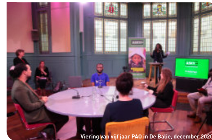
Viering van vijf jaar PAO in De Balie, december 2020

Bovendien heeft PAO met succes geëxperimenteerd met een strategische procedure, die ongedocumenteerde jongeren de mogelijkheid moet bieden een studieverblijfsvergunning aan te vragen. Deze strategische procedure heeft er al toe geleid dat een Braziliaanse vrouw zonder papieren voor het eerst in acht jaar legaal in Nederland kan wonen en studeren. Dit succes schept een precedent voor andere ongedocumenteerde jongeren die hoger onderwijs willen volgen.