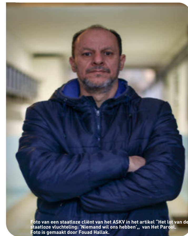
Foto van een staatloze cliënt van het ASKV in het artikel "Het lot van de staatloze vluchteling: 'Niemand wil ons hebben'", van Het Parool.