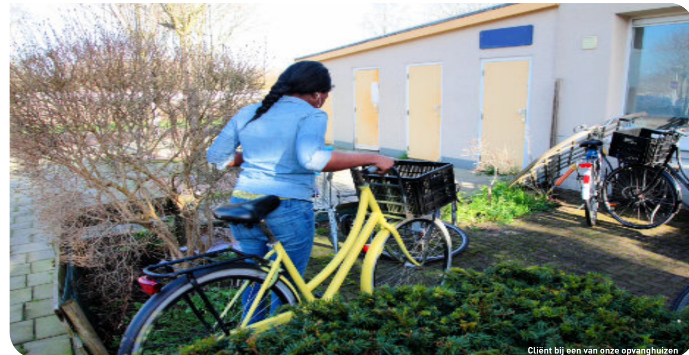
Clïent bij een van onze opvanghuizen

Voor iedereen binnen ASKV was dit een probleem: het voortdurend veranderende coronabeleid zorgde ervoor dat we veel tijd kwijt waren met het uitzoeken hoe we ons steeds aan de richtlijnen van het RIVM konden blijven houden en toch zoveel mogelijk in contact konden blijven met onze cliënten. Het was moeilijk te bepalen wat voor iedereen, zowel medewerkers als cliënten, het veiligst was.