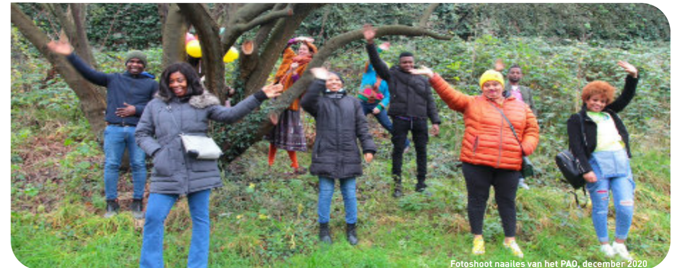
Fotoshoot naailes van het PAO, december 2020

In het najaar van 2021 willen we, mits corona dat toestaat, een Week van het ASKV organiseren. In verschillende delen van de stad willen we activiteiten organiseren met ongedocumenteerden om hun verhalen onder de aandacht te brengen van Amsterdammers, politiek en media.