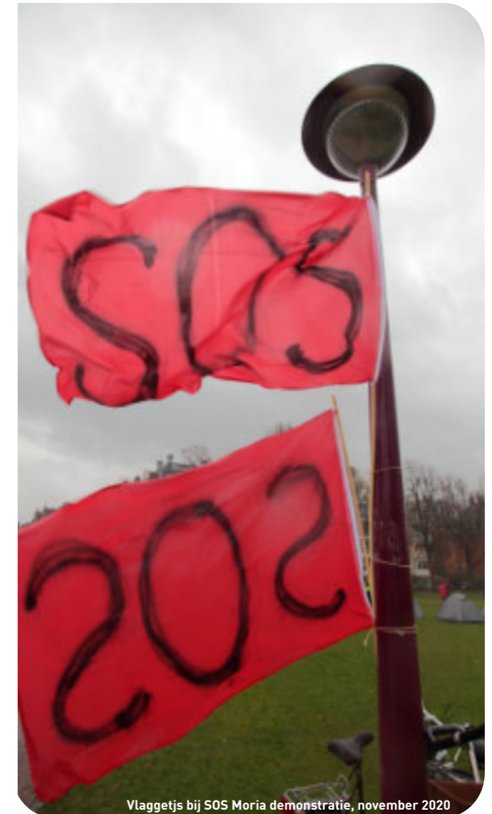
Vlaggetjs bij SOS Moria demonstratie, november 2020

Naast onze kerntaak – het bieden van juridische en maatschappelijke hulpverlening – hebben we in de loop van de jaren verschillende activiteiten ontwikkeld om de impact en effectiviteit van ons werk te versterken. Daarbij werken we altijd vanuit de dagelijkse werkelijkheid van ongedocumenteerden in Amsterdam: alle activiteiten worden ontwikkeld vanuit wat we in de praktijk leren over de noden van onze cliënten. Hierbij werken we altijd nauw samen met partners die daarvoor relevant zijn, zoals hulpverleners, gemeenten, overheidsinstellingen, advocaten, opleidingsinstituten en andere maatschappelijke organisaties.