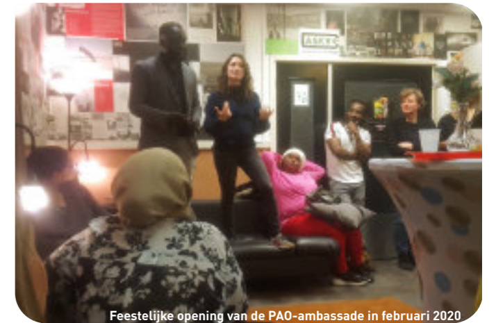
Feestelijke opening van de PAO-ambassade in februari 2020

De PAO-ambassade is in het najaar van 2019 opgericht in Het Blauwe Huis in Amsterdam-Oost. Samen met mensen die ongedocumenteerd zijn en buurtbewoners was de PAO-ambassade begonnen met het ontwikkelen van verschillende initiatieven zoals taalcafés, evenementen en lunches in het pand. Hiervoor zouden er projectgroepen worden gevormd,